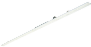
Maxos Fusion Panel-LL523X WB WH