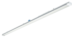
Maxos Fusion Panel-LL623X