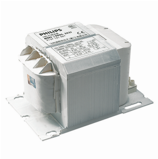
BSN 1000L 3021