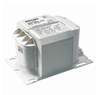
BMH 1800 & 2000