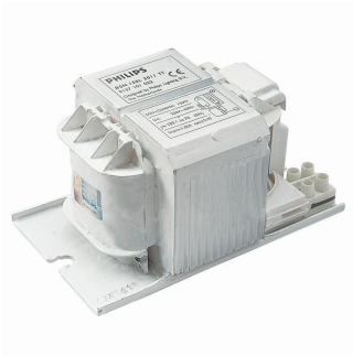
BHL 250L 200